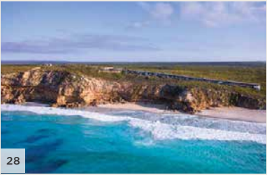
SOUTHERN OCEAN LODGE Île Kangaroo, Australie méridionale