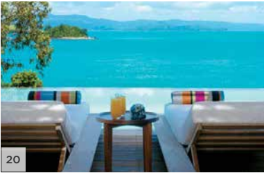
QUALIA Grande barrière de corail, Queensland