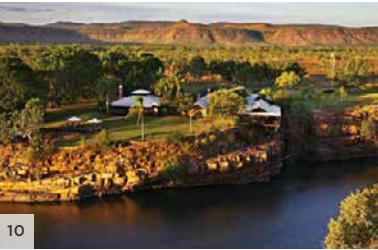
EL QUESTRO HOMESTEAD The Kimberley, Australie occidentale