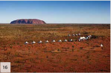
LONGITUDE 131° Ayers Rock (Uluru), Territoire du Nord