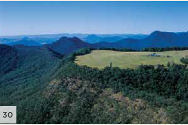
SPICERS PEAK LODGE Scenic Rim, Sud-Est de Queensland