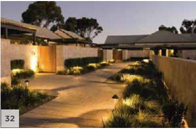
THE LOUISE Vallée Barossa, Australie méridionale