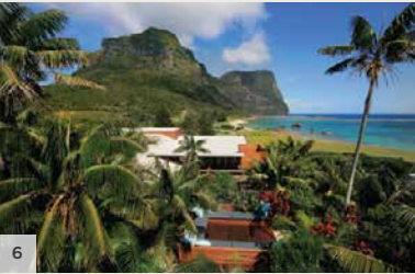
CAPELLA LODGE Île de Lord Howe, Nouvelle-Galles du Sud