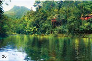
SILKY OAKS LODGE The Daintree, Queensland