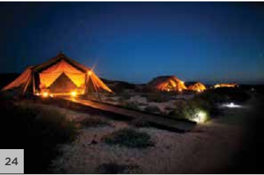
SAL SALIS Ningaloo Reef, Australie occidentale