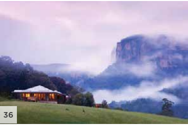
WOLGAN VALLEY RESORT & SPA Montagnes Bleues, Nouvelle-Galles du Sud