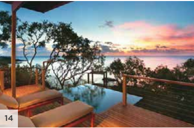
LIZARD ISLAND Grande barrière de corail, Queensland