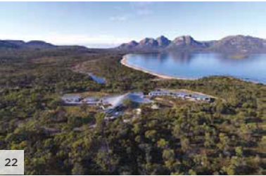
SAFFIRE Freycinet, Tasmanie