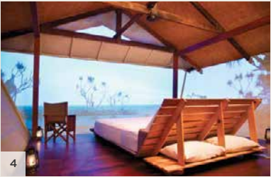
BAMURRU PLAINS Top End, Territoire du Nord