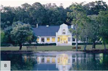
CAPE LODGE Rivière Margaret, Australie occidentale