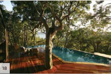
PRETTY BEACH HOUSE Bouddi Peninsula, Nouvelle-Galles du Sud