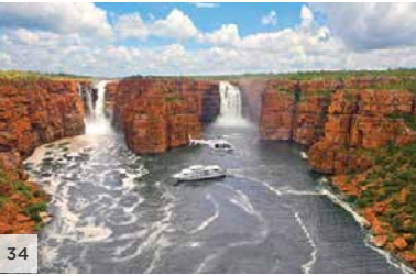
TRUE NORTH The Kimberley, Australie occidentale