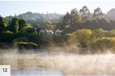
LAKE HOUSE Daylesford, Victoria